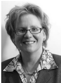
Qualitätsgutachterin für das DVVO Qualitäts-Siegel NLP Practitioner